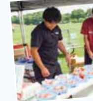
トマトの販促イベントへ参加