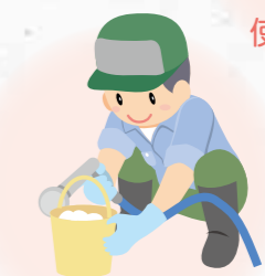
洗浄して片付けよう