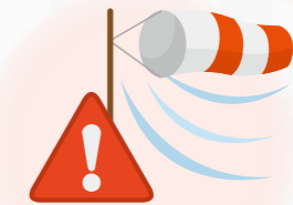
飛散に気を付けよう