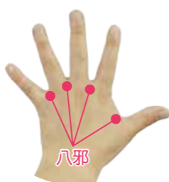
八邪の位置。指の間の水かき部分(手の甲側)にあります。

指の間こすりで体調スッキリ！ 今回は、八邪(はちじゃ)というツボを刺激する体操を紹介します。指と指の間にあるツボは両手を合わせて8カ所あり、まとめて八邪と呼ばれます。八邪は東洋医学では気が滞りやすい場所と考えられており、刺激を与えることで代謝や気の巡りが良くなるといわれます。やる気が出ないときや眠気を感じたときや、簡単な作業の合間やおしゃべりしながらなど、気が付いたときにやってみると良いでしょう。