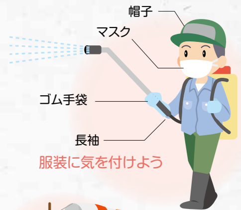
服装に気を付けよう

尚、防除保護具はJAでも取り扱っております。在庫状況や価格等につきましては、最寄りのJA購買店舗へお問い合わせ下さい。