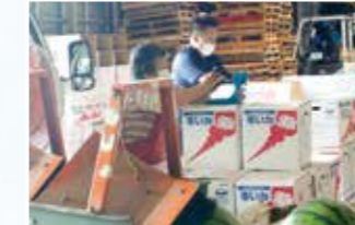
若松大玉スイカ出荷作業の様子