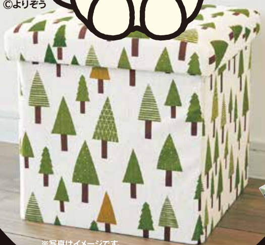
※写真はイメージです。 実際の商品と異なる場合がございます。